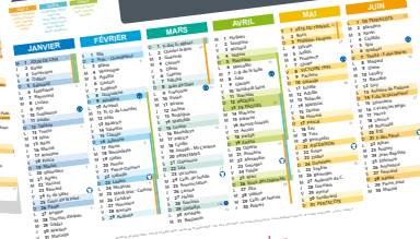
Version 3 en couleur