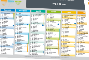
Version 2 avec fond